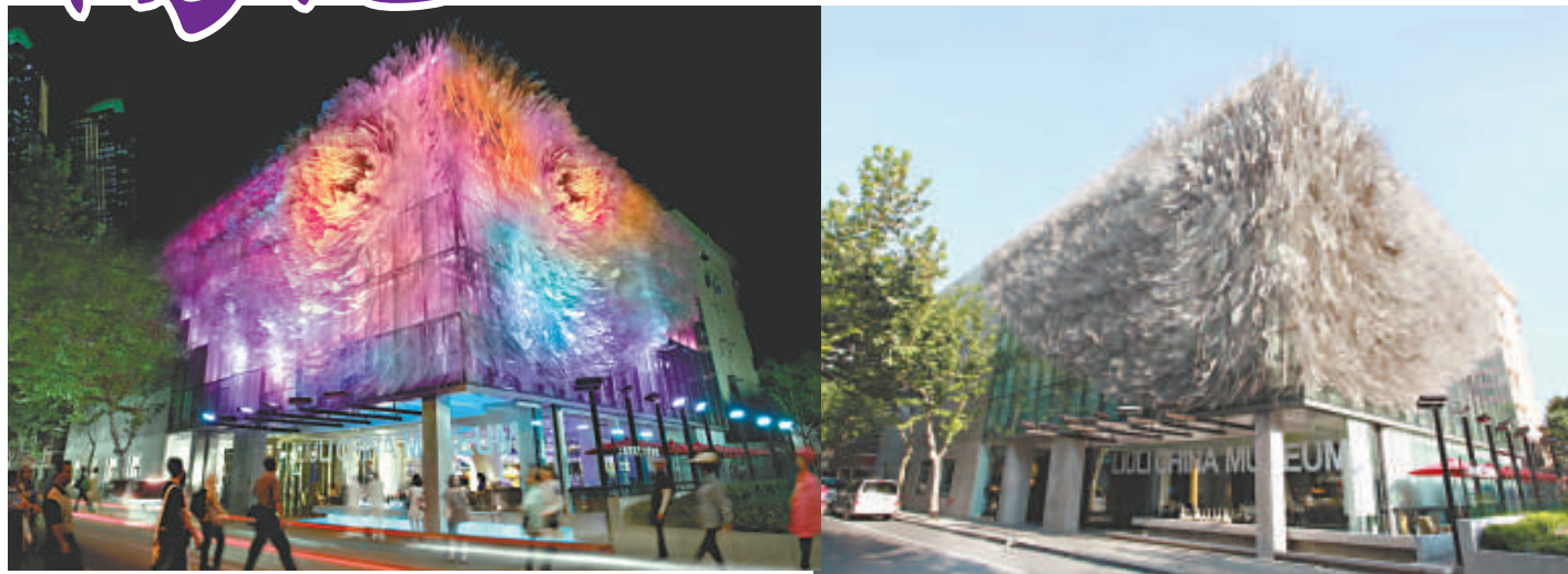
▲上海琉璃藝術博物館外觀，白天，花影靜謐（右）；入夜，花姿絢麗（左）