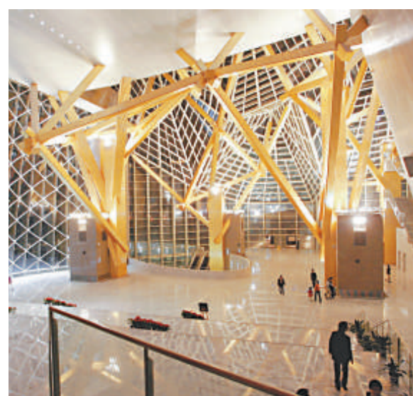
▲深圳金樹大廳夜景

在派票方面，本年度特別在兩個新區，包括光明新區與龍華新區新增現場派票點，在光明圖書館、光明圖書館及龍華街道圖書館爲兩區市民免費派發公益演出門票。目前派票點已達到二十六個，而網絡與電話領票的方式今年也將繼續。