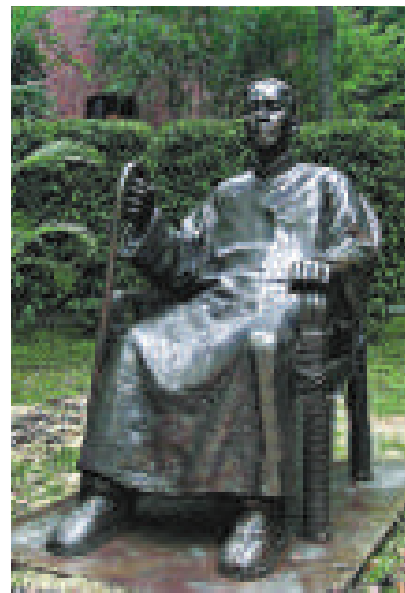
◀陳寅恪銅像是繼孫中山先生雕像之後豎立在中山大學的校園中的第二座名人全身戶外雕像

文章說，能在繁忙的工作之餘，安靜地讀一些書，選擇性地讀一些好書，對於領導幹部來說也是一種本領。當今時代瞬息萬變，新情況、新問題層出不窮，對領導幹部的執政能力提出了新要求。工作之餘唯有多學習、多讀書、讀好書才能更好地勝任工作。作為黨員幹部，該讀什麼書，愛讀什麼書不僅是個人愛好，更直接影響著黨的執政能力和先進性。毛澤東並非出生於書香門第，他一生對書的熱愛完全是出於對社會、對人生、對真理思考的需要。周恩來一生熱愛讀書，掌握多國語言，才學豐富。一個脫離低級趣味、品德高尚的幹部，靠的是不斷閱讀關於人生修養的書籍。