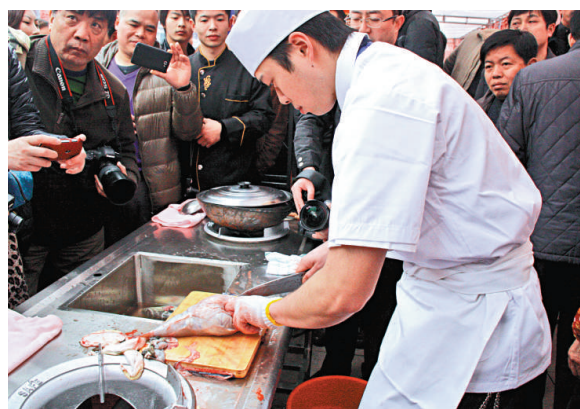
▲一位廚師在宰殺河豚

【本報記者賀鵬飛南京十九日電】又到長江野生河豚上市季節，不過隨着數量日漸減少，長江野生河豚價格不斷飆升。其中瀕臨絕跡的野生河豚目前每條售價高達一兩萬元人民幣，如此「天價」實在令人咋舌。