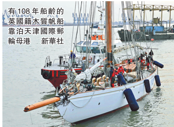
有108年船齡的英國籍木質帆船「超級瑪麗」號靠泊天津國際郵輪母港

「超級瑪麗」上共搭載8名「乘客」，1名船主、6名船員和1名中國翻譯。據了解，該船2012年1月2日從新加坡出發，先後經停台北、香港、上海、天津，之後將前往青島以及韓國等地，計劃於6月30日返回新加坡，全程1.13萬多海里。