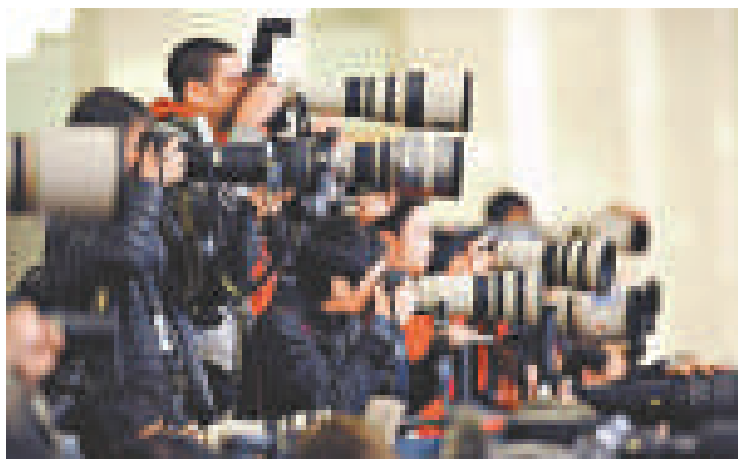
▲就算審查尺度較寬鬆，新聞傳媒也不一定暢所欲言

今天，要封殺言論，十分困難。各利益集團要爭取民意，化解危機，只能用積極的手法，那就是聘用專業的公關公司及顧問公司，高薪聘請新聞從業員，為它們主動散播有利的消息，設定議題，轉移市民的視線。政府有新聞處發布新聞，或透過所謂消息人士探測民意。政黨、壓力團體及非政府組織則搞記者招待會、發表調查報告、遊行、請願等等，爭取民意。新聞傳媒能否不受上述各種力量的擺布及影響？在決定公眾議題方面，能否代表真正公眾的利益，為沒錢、沒權的弱勢社群發聲？