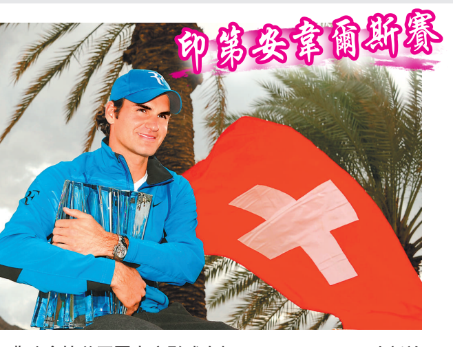
▲費達拿捧着冠軍寶座影威水相

【本報訊】據新華社華盛頓十八日消息：在美國印第安韋爾斯網球賽男單決賽中，3號種子、「瑞士球王」費達拿以7:6(9:7)、6:3擊敗本土選手伊士拿，捧起個人第四座印第安韋爾斯男單冠軍獎杯，追平了西班牙網球名將拿度的大師賽奪冠紀錄。