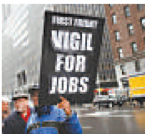
▲金融海嘯導致美國各族群、各年齡階層的工人受衝擊，白人和少數族裔的財富差距一度擴大到25年的最嚴重程度。失業問題進一步惡化

不過，Allstate和大西洋周刊的聯合調查反映，認為今天的孩子比他們擁有更多機會的拉美裔和非洲裔美國人，是白人的2倍。