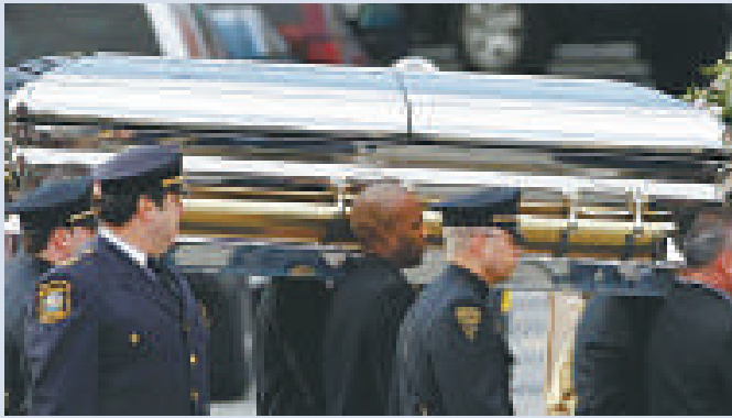
▲2月18日，侯斯頓葬禮在紐瓦克舉行 資料圖片

雲妮逝世後，民眾對其音樂熱情重燃，她的唱片重回暢銷榜榜單，歌曲也在廣播裡也不斷重放。2月18日，48歲的侯斯頓葬於新澤西州的墓地，長眠在父親身旁。