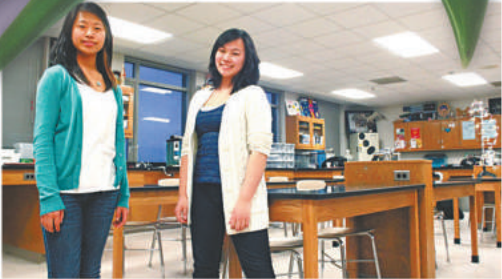
▲華裔學生多蘿西（左）和薩拉（右）贏得太空計劃競賽