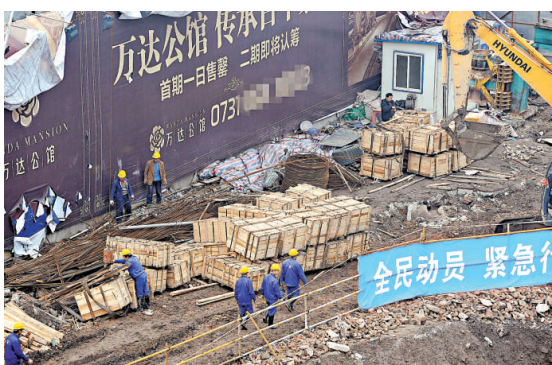
▲長沙古城牆的「拆」「保」拉鋸反映了中國城市建設的矛盾。圖為18日工人準備轉移已拆除的古城牆，背景是將建於此的萬達公館廣告 資料圖片

【本報訊】去年10月，一段價值「堪比馬王堆漢墓」的120米古城牆在長沙某商業工地施工現場被發現，而長達數月的有關「拆」與「保」的拉鋸戰也就此展開。幾經博弈後，除23米古城牆得以原地保留外，其餘均被切割後移往異地保護。中新社24日撰文指，長沙古城牆的命運，或許將成為中國很多仍