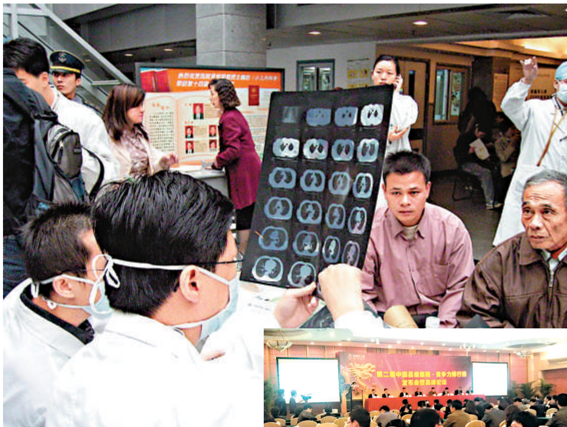
▲►專家指出，今屆中國「百強」縣級醫院榜單表明，醫療資源遠落後於醫院規模會導致廣東縣級醫院發展「跛腳」

另外，與上屆相比，80%的入榜醫院仍源於東部經濟區，並囊括了前20強，領航縣級醫院的發展。至於中部經濟區的入榜醫院增幅最大，達到25%。但