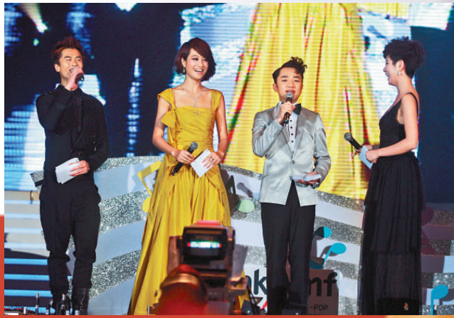
▲王祖藍（右二）任司儀，風趣幽默