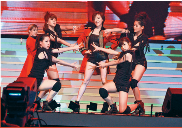
▲韓國的Brown Eyed Girls勁歌熱舞，令現場氣氛高漲

二人透過翻譯接受訪問，他們直言很高興跟香港歌迷會面。他們說：「我們在1月至3月忙於在日本巡迴，現在又來港表演，體力一定下降，但是開騷時看到fans即時精力充沛。」另外，前晚同場舉行的超級新星大賽，最終由韓國女歌手Ali勝出，她並贏得《最佳歌曲演繹大獎》。台灣歌手倪安東亦連下兩城，贏得《騰訊人氣大獎》和《最佳舞台演繹大獎》。