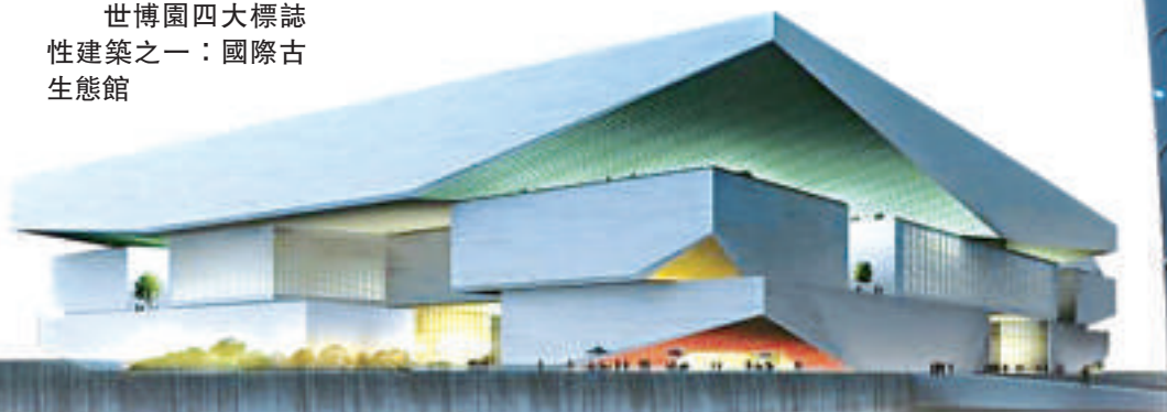
世博園四大標誌性建築之一：國際古生態館