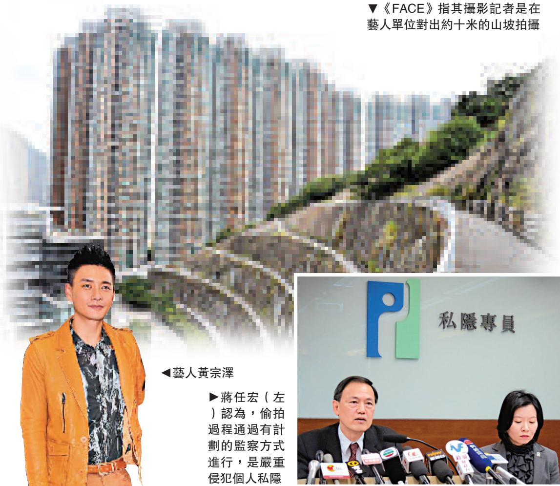
▼《FACE》指其攝影記者是在藝人單位對出約十米的山坡拍攝

他強調，公眾利益必須是值得公眾關注的事項，不論個人社會地位和職業如何，其私生活都應獲得保護，不得在沒有充分理由下受到侵擾。三名藝人可循民事途徑索償，而私隱專員公署已向兩間雜誌社發出執行通知，要求他們糾正有關違反事項，惜對方已提出上訴。