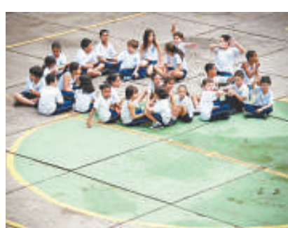
▲巴西學校校服裝晶片防學生逃學 互聯網

教育學家努尼斯認為，電子控制器雖然有助防止學生逃學，但不能解決根本問題。他說，高品質的教育牽涉到學制、學校管理、師資和課程內容等因素，學校必須加強與學生家庭及社區的合作與互動，才能確實提高對學生學習的影響力。