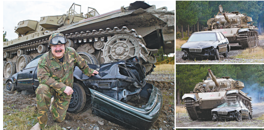
▲一名加拿大的旅客在坦克旁邊留影

負責電子書出版的發言人表示，Pottermore尚未與蘋果公司達成類似的協議，這意味着哈利波特系列書籍不會出現在蘋果的iBookstore中。持有蘋果裝置的人需透過其他零售商的應用程式，才能購買這套電子書。蘋果發言人對此拒絕置評。