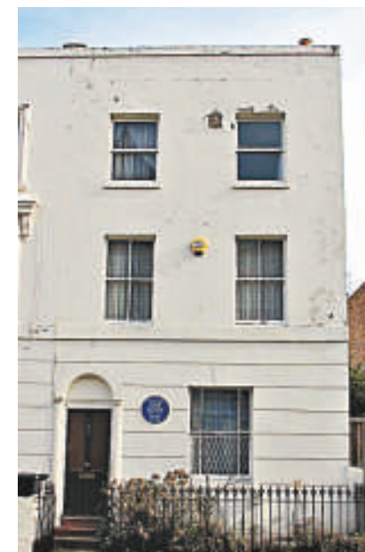
▲梵高位於倫敦的故居外觀

《星空》、《向日葵》和《烏鴉群飛的麥田》等成為不朽之作。1890年7月29日，他在法國瓦茲河畔舉槍自殺，年僅37歲。