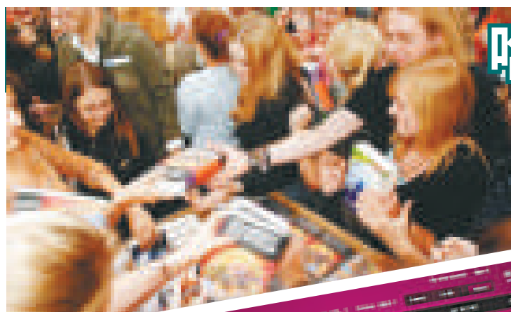
▲每逢《哈利波特》出書，必遭瘋搶