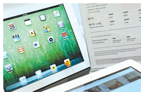
▲新iPad的4G功能僅限北美地區使用

蘋果在官網上列明，新iPad的「4G LTE」無線通訊技術僅支持美國及加拿大的網絡。雖然新iPad的4G網絡與亞太地區跟歐洲現開售國家（如日本、英國、法國及德國）的網絡不兼容，其銷量依然驚人。根據