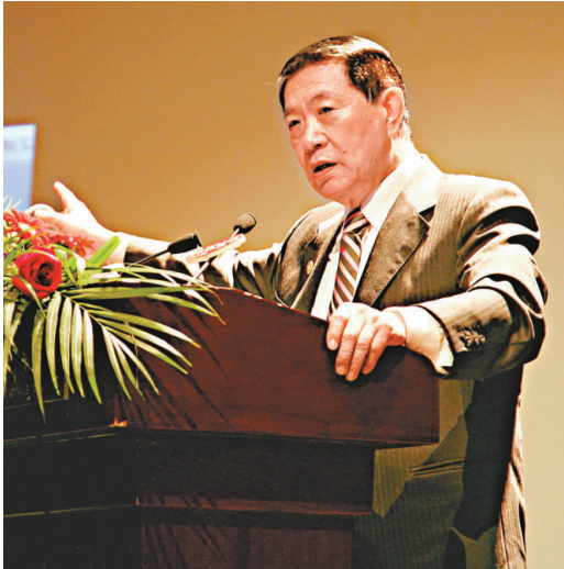
▲神探李昌鈺30日來到浙江工商大學進行《物證科學的新定位——分享成功的經驗》的演講

李昌鈺出生於江蘇省如皋一個富裕鹽商家庭，1949年前後他隨母親和其他家人一同遷往台灣，其父則在搭乘太平洋輪前往台灣時不幸遇難身亡。李昌鈺曾自言父親的過世使家庭經濟遭受巨變，促使他選擇投考公費的警校。1960年於島內中央警官學校（現在的中央警察大學）取得警察科