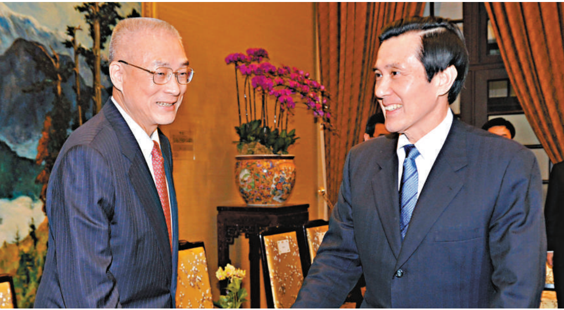
▲馬英九(右)30日接見參加「2012博鰲亞洲論壇」代表團成員，左為榮譽團長吳敦義

博鰲論壇從2003年第一屆年會開始，現任「副總統」蕭萬長多次率團出席。馬英九在是次發言中特別稱