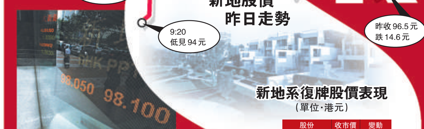
◀郭炳湘或有機會重掌新地