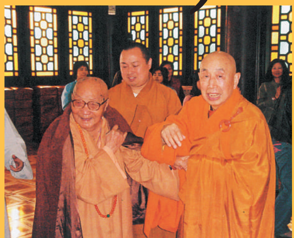
二〇〇四年，本煥、香港佛聯會會長覺光等八位高僧聯合倡議在中國設立「世界佛教論壇」。圖為本煥長老(左)、覺光長老(右)在香港會面

眼裡要有大眾的影子， 耳裡要有大眾的聲音，心裡 要有大眾的功德，身上要有 大眾的恩惠。