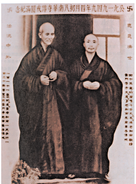
▲一九四八年，中國佛學大師、禪宗高僧虛雲長老（左）誠邀本煥（右）到韶關南華寺，傳以衣鉢。同年十一月，本煥接法於虛雲宗下，成為臨濟宗第四十四代傳人

老闍娘信佛，經常帶他到報恩寺拜佛燒香，並勸他信佛。面對國家外侮內亂，政府腐敗，社會黑暗，公理不張的現實，本煥遂萌出塵之志。1930年1月15日決志離塵，在報恩寺傳聖法師座下披剃得度。同年4月8日到武昌寶通寺持松長老座下圓具，從此開始長達80餘年的出家生活。