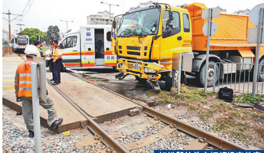
▲泥頭車與輕鐵相撞，兩車皆車頭損毀，輕鐵更衝前十多米始停下

受事件影響，有四條途經現場路段的輕鐵路線，被迫暫停服務，包括610、614、615及751線，期間港鐵需安排多輛接駁巴士，協助疏導受影響乘客。在下午一時許，現場解封後交通恢復正常。