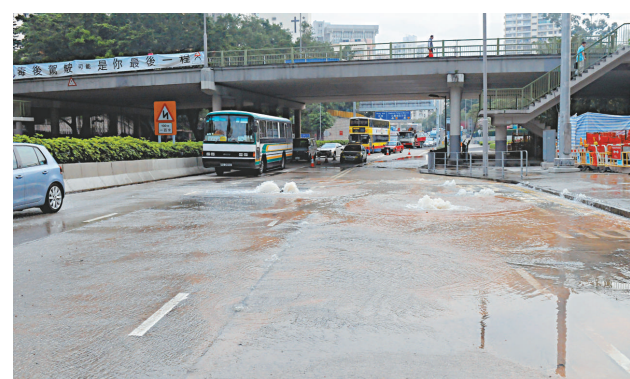
▲何文田公主道昨日清晨有地底水管爆裂，附近馬路頓成澤國

現場在公主道往紅磡方向近培正道，據悉，出事的水管直徑八吋，初步估計因為老化問題突然爆裂。事發昨日清晨六時許，因該條水管爆裂，路面積水逾吋有如澤國，馳至汽車需要慢駛。警員接報到場，一度將中線及慢線封閉，以便水務署人員搶修；受封路影響，往紅磡方向交通受阻，初步估計現場道路，可趕於今日重開。