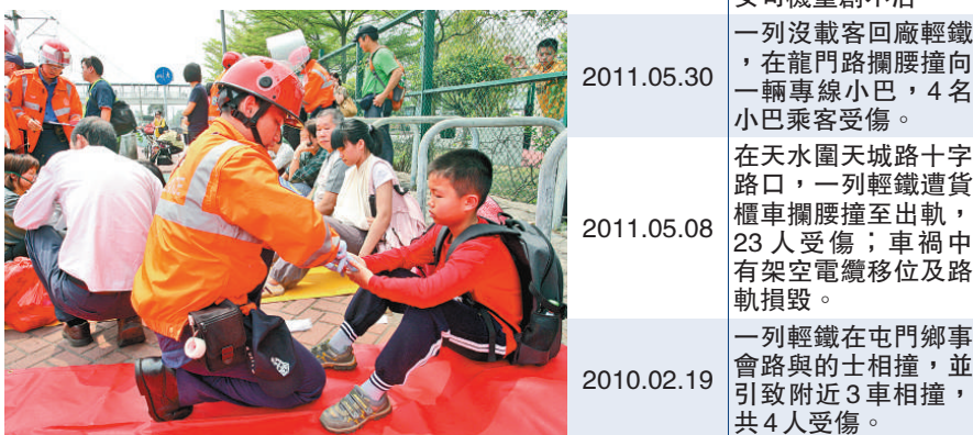
▲消防處出動多輛救護車到場救援，同時派出一輛流動救護醫療車到場救治傷者