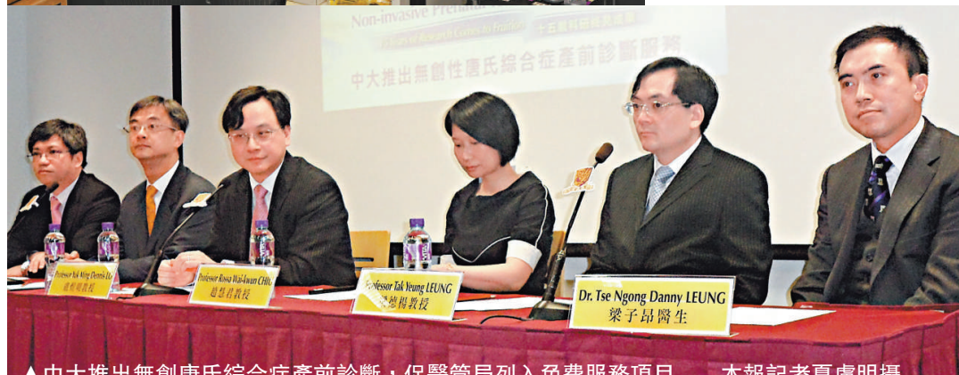
▲中大推出無創唐氏綜合症產前診斷，促醫管局列入免費服務項目

盧煜明指出，中大去年底才開始推出此服務，但他們知道有私家醫生去年六月已經推出假冒服務，樣本並非送往中大認可的化驗室。而據他們了解，有醫生已經進行二萬個測試，更聲稱作研究用途，會考慮採取法律行動。他們又提醒病人若有意接受診斷，須清楚樣本是否送到中大進行測試，若不是則有機會屬假冒。