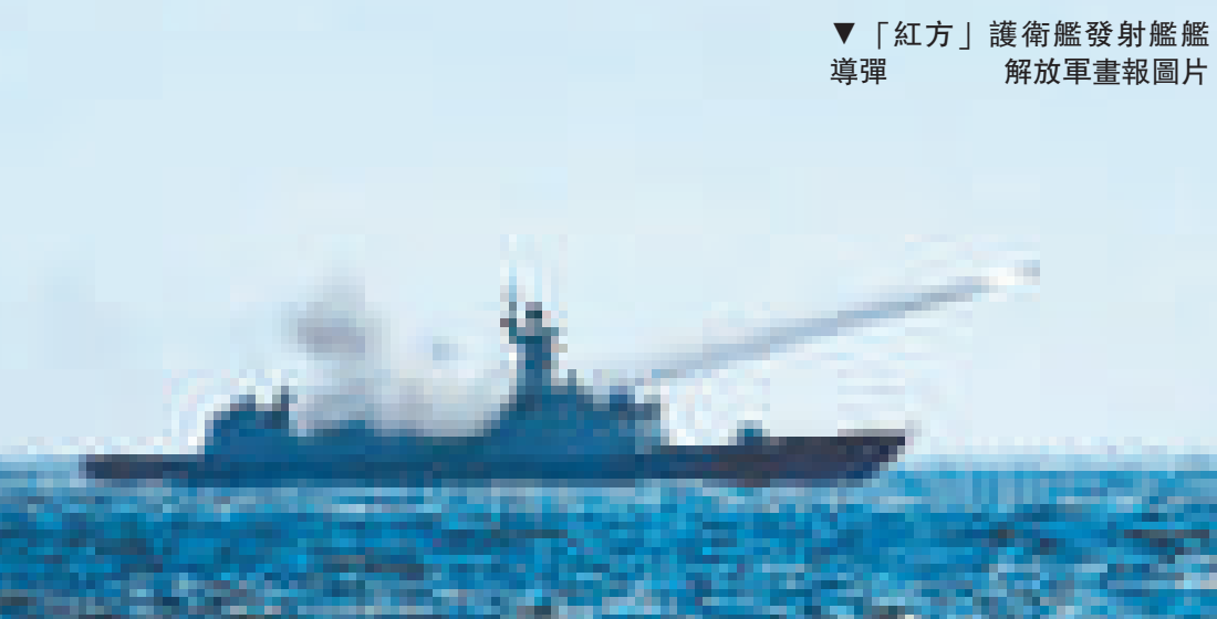
▼「紅方」護衛艦發射艦艦導彈