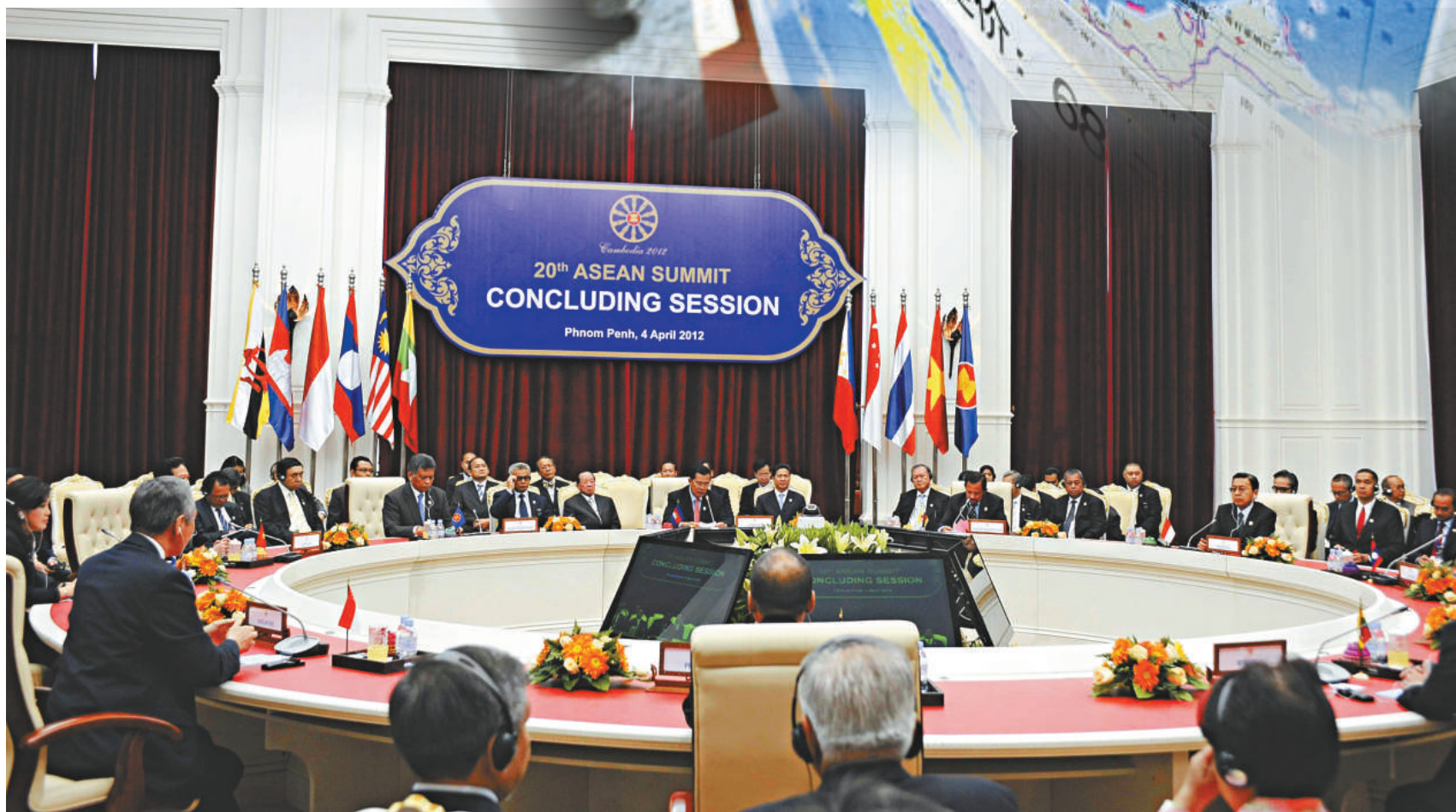
▲4日在柬埔寨首都金邊拍攝的第20屆東盟峰會閉幕會場