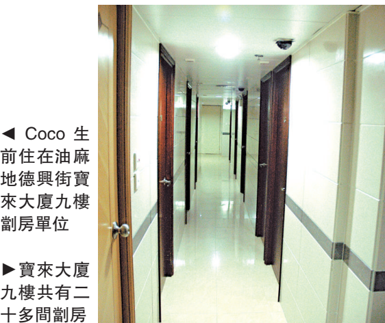
◀ Coco 生前住在油麻地德興街寶來大廈九樓劏房單位 ▶ 寶來大廈九樓共有二十多間劏房

，據悉早年離婚，在四個月前與一名姓莫(三十餘歲)、花名「猩猩」的男子共賦同居，兩人在油麻地德興街九至十號寶來大廈九樓，一個約二百呎劏房居住，街坊指該樓層共有二十多間劏房，月租約四千至六千元，劏房的住客有本地及內地人，以及外籍人士。有住客指，前日大批探員到A2及A16兩個劏房調查，他們異口同聲表示不知道兩間劏房住客身份，探員調查後檢走一批證物。此外，Coco在同一大廈四樓一間夜總會任女公關，夜總會昨日如常營業，負責人三緘其口拒絕回答提問。