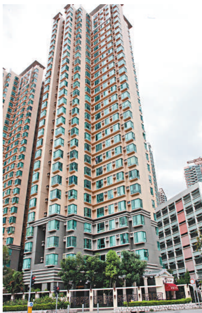
▲屯門嘉悅半島已有十年樓齡 ▲肇事升降機已暫停使用