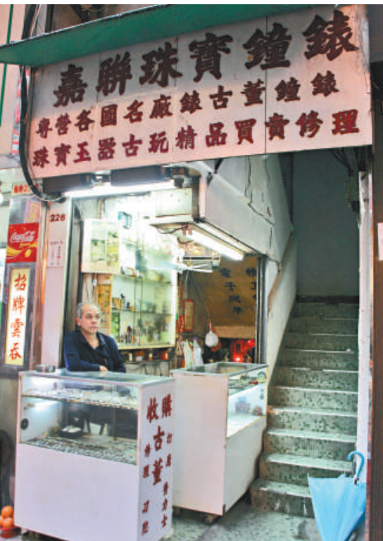
▲店東表示將加裝防盜設施