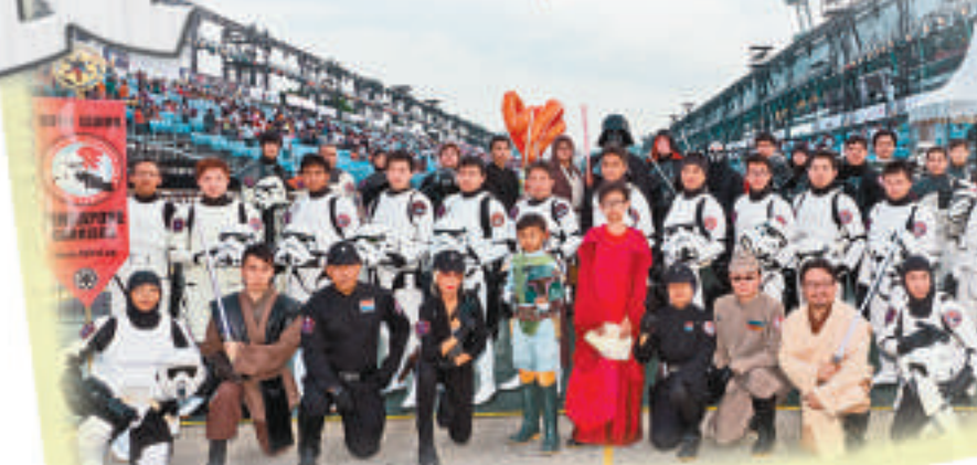
▲參加新加坡的大型巡遊

501st 部隊的香港分部已成立 5 年，目前約有 30 名會員。根據美國總部守則，穿起白兵裝甲便須肩負宣揚《星球大戰》的任務；除此以外，一如其他 501st 部隊一樣，香港分部經常到處做慈善、義務工作，過去 5 年曾經參與的活動包括奧比斯光明行、盲俠行、聖誕節到醫院探訪兒童派發玩具等，全部活動屬義務性質，不收分文，「壞人做好事」的故事從此誕生。