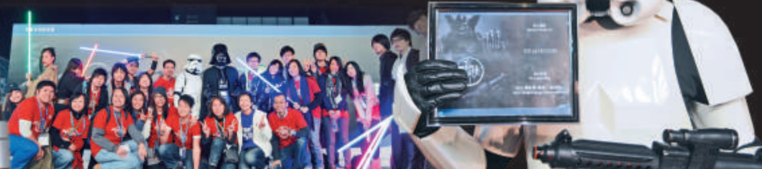
◀參與奧比斯慈善活動