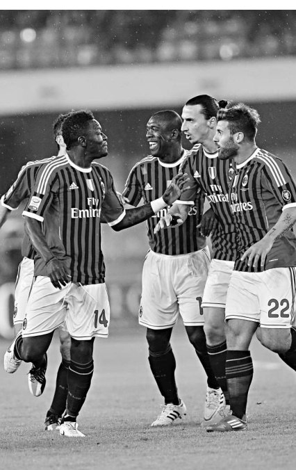
▲蒙達利(左二)一箭定江山