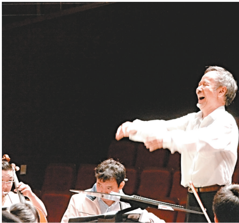
▲黃輔棠指揮深圳交響樂團排練