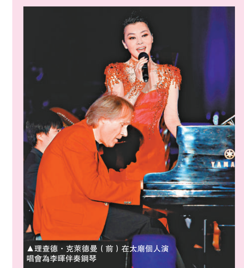
▲理查德·克萊德曼（前）在太廟個人演唱會為李暉伴奏鋼琴