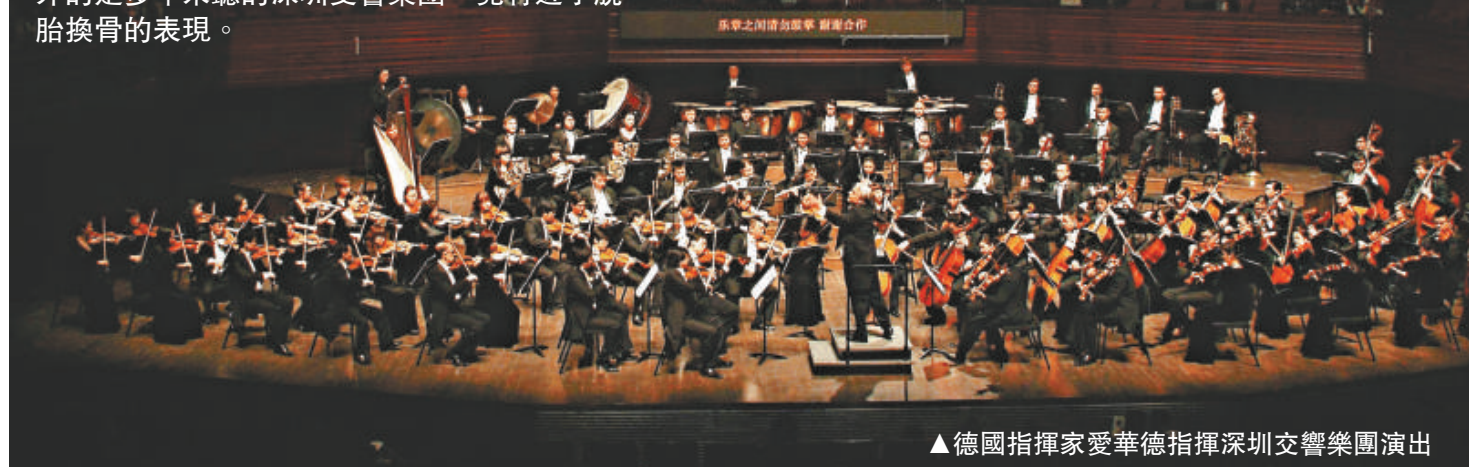
▲德國指揮家愛華德指揮深圳交響樂團演出

這次在深圳音樂廳第三次欣賞阿鏜（黃輔棠）的大型管弦作品《神鵰俠侶》交響樂，深深體會其追求藝術鍥而不捨的精神，更有點意外的是多年未聽的深圳交響樂團，竟有近乎脫胎換骨的表现。