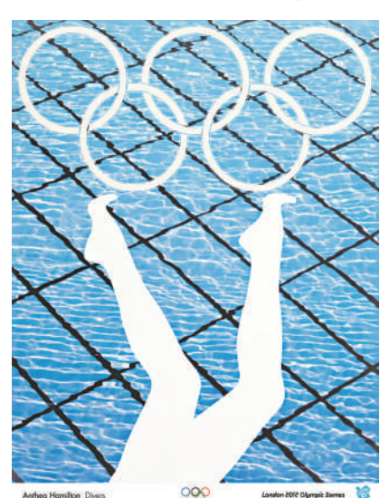
▲安非亞·威美頓的《跳水員》

作為「藝述英國——英國藝術及創意產業節」的旗艦活動，香港的「倫敦2012——奧運海報展」乃中國巡迴展覽首站，亦標誌「藝述英國」在香港揭幕。