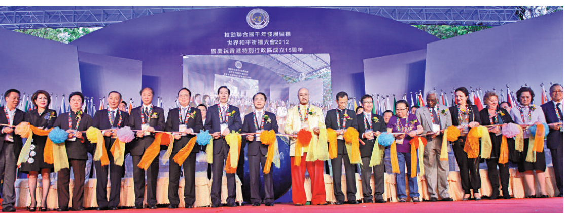
▲「世界和平祈禱大會」昨在維多利亞公園隆重開幕

「聯合國千年發展計劃」是聯合國一百九十一個成員國通過的一項旨在將全球貧困水準在二〇一五年之前降低一半的行動計劃，內容涵蓋了消除貧困、飢餓、疾病、文盲、環境惡化和對種族的歧視等相關領域。