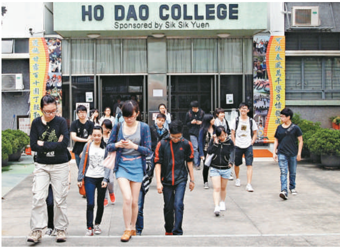
▲中史科試題容易，考生步出試場，顯得心情輕鬆

卷二考題方面與練習卷有諸多類似之處，如單元二地理方面，練習卷中三題分別為試就地理、經濟和