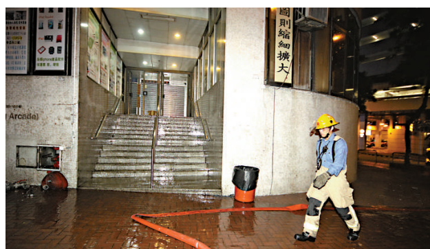
▲荃灣西樓角路一間書店昨日遭祝融光顧