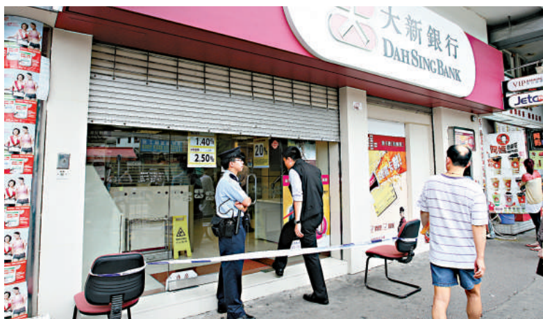
▲元朗安寧路大新銀行昨日被打劫

警方昨日再拘捕另外兩名男女，令被捕者總人數增至七人。最新落網兩男女，其中二十六歲的女子昨日下午在八鄉區被捕，另一名二十八歲男子，則在昨晚於羅湖被捕。