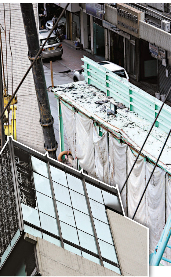
▶北角海逸君綽酒店幕牆玻璃昨晨突然爆裂墮地