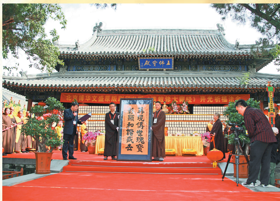
中國佛教協會會長傳印長老為修復出版印刷《清敕修大藏經》所題賀詞

此次重印《清敕修大藏經》，是當代佛教界、文化界和出版發行界一件大事，它的問世使《清敕修大藏經》自首刊以後，第一次恢復到乾隆初印本原貌，補齊、更正了歷代印本中缺失卷次和刊誤文字，如《楞嚴經