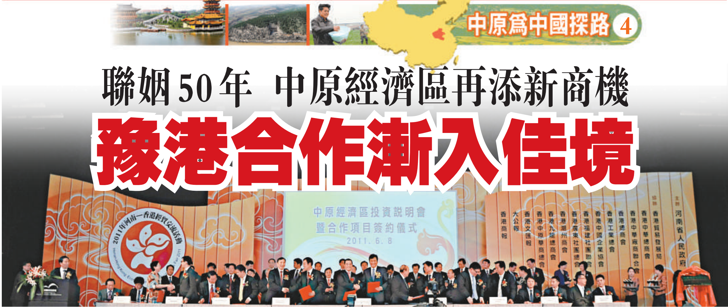
▲豫港兩地有着深厚的合作基礎和廣闊的合作前景，圖為「2011年河南—香港經貿交流活動」去年6月在香港舉行