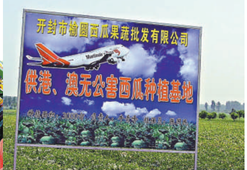
▲開封市榆園西瓜蔬菜批發有限公司供港澳無公害西瓜種植基地