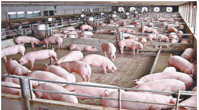
▲河南五豐糧油羅山縣豫鳴畜牧供港豬場

多名受訪供港食品負責人和官員對大公報表示，不論對企業還是當地政府，供港食品安全不僅是貿易雙方的關係，更是一項政治任務。