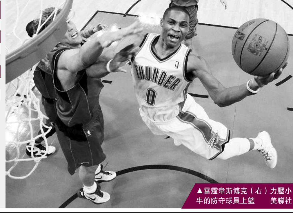
▲雷霆韋斯博克(右)力壓小牛的防守球員上籃