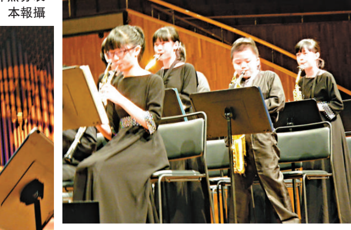
▲管樂團成員落力表演