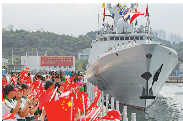
▲「海口」艦和「運城」艦，於昨日上午結束在本港四日的停靠，離港返航 新華社