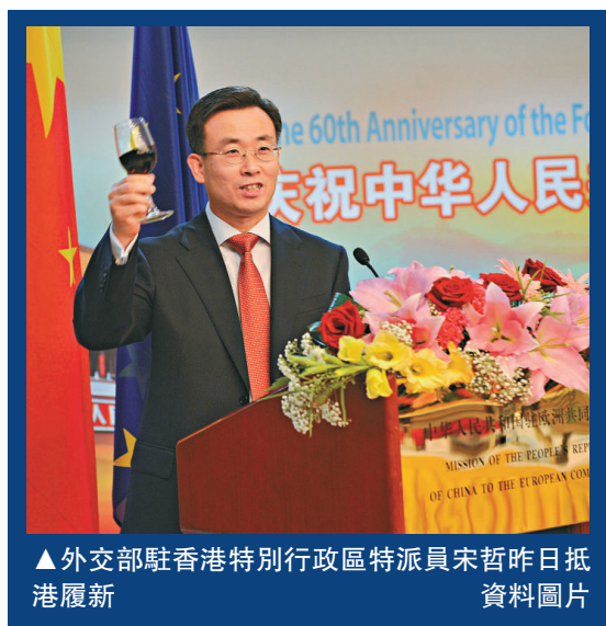
▲外交部駐香港特別行政區特派員宋哲昨日抵港履新 資料圖片

【本報訊】外交部駐香港特別行政區特派員宋哲昨日抵港履新。據公開資料顯示，宋哲歷任中國駐歐盟使團團長、特命全權大使，國務院辦公廳局長，外交部西歐司司長，外交部西歐司參贊等職。