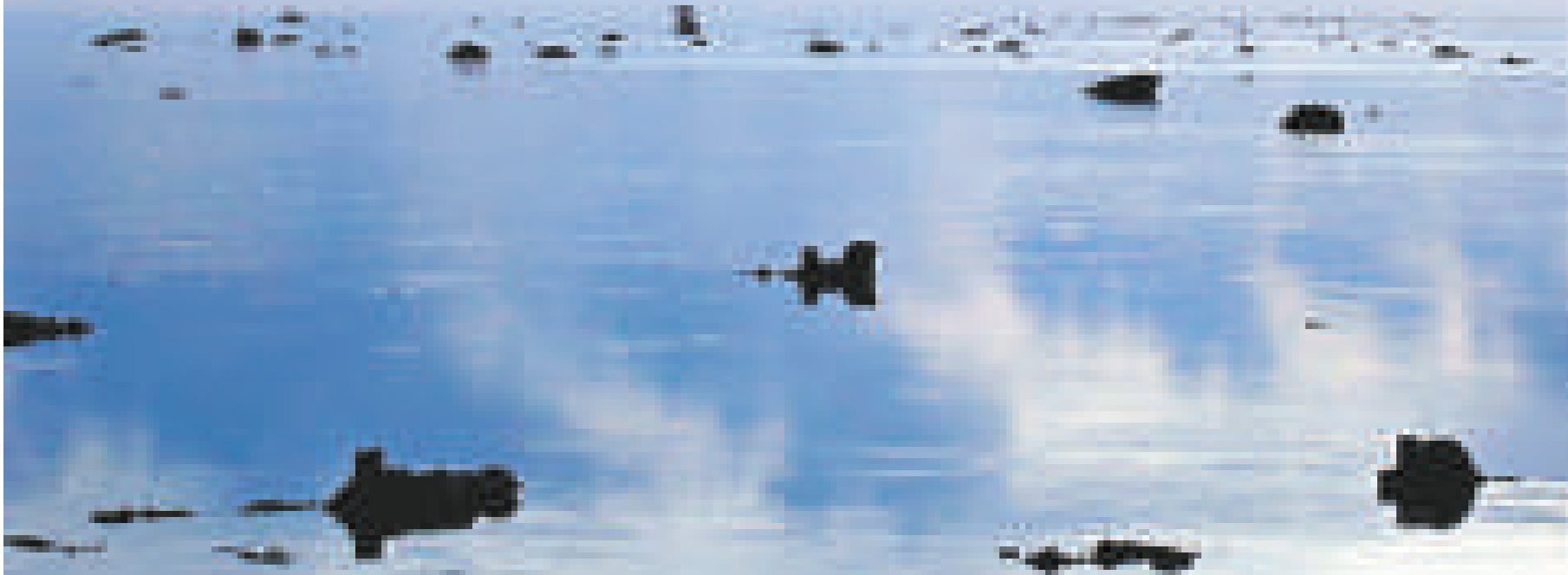
▲黃岩島是中國的固有領土，是中國中沙群島中唯一露出水面的島礁。圖為黃岩島礁塊出水圖資料圖片

交部以及教育部等官方機構派員組成水陸地圖審查委員會，在該委員會審定公布的南海諸島132個島礁沙灘中，黃岩島作為中沙群島的一部分被列入中國版圖。1947年，中國政府內政部地方司審定公布南海諸島地名172個，黃岩島以民主礁的名稱，列在中沙群島範圍內。1948年，在中國官方印製出版的《南海諸島位置圖》中，黃岩島被明確劃入了中國南海傳統海疆線內。