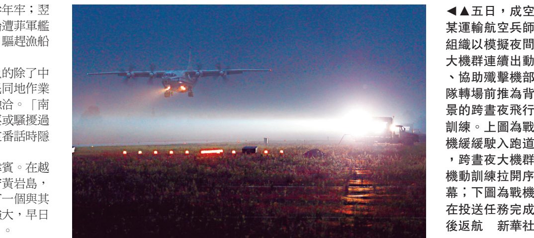
▲五日，成空某運輸航空兵師組織以模擬夜間大機群連續出動、協助殲擊機部隊戰場前推為背景的跨晝夜飛行訓練。上圖為戰機緩緩駛入跑道，跨晝夜大機群機動訓練拉開序幕；下圖為戰機在投送任務完成後返航