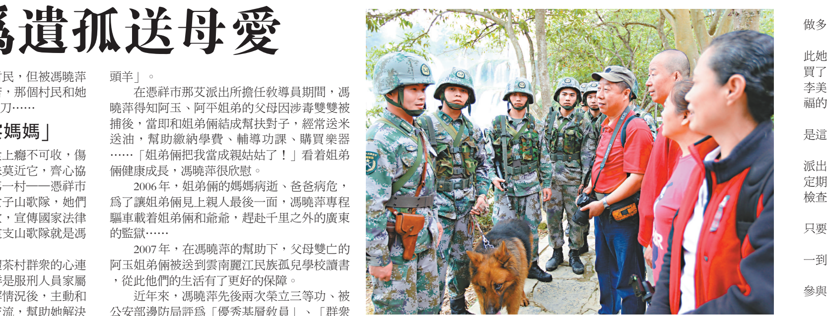
▲巡邏途中的廣西邊防官兵向遊客宣傳邊境政策