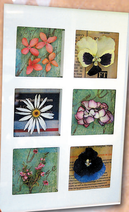
▲麗乾花可立體地製作成藝術品

展覽：「春日押花展」及「麗乾花藝術展」 展期：即日起至五月十四日 時間：上午十時至晚上十時 地點：上水廣場二樓中庭 查詢：二六三九九六三八