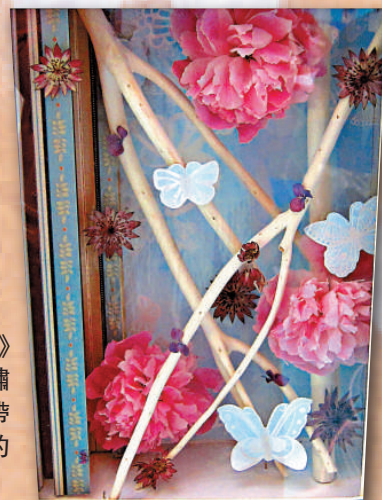
►《春回大地》用牡丹、紫繡球、粉珍珠帶來春意盎然的氣息

展覽：「春日押花展」及「麗乾花藝術展」 展期：即日起至五月十四日 時間：上午十時至晚上十時 地點：上水廣場二樓中庭 查詢：二六三九九六三八