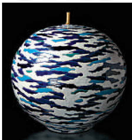
▲中村元風（日本）《FUKURATE 地》，陶瓷