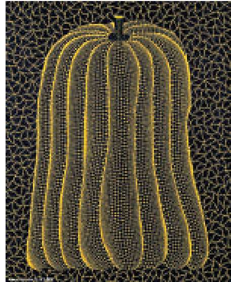
▲草間彌生（日本）《南瓜》，版畫

本次活動主辦方還特別指出，「盛世收藏」是本次展覽體現的核心理念，通過定位投資收藏的高端市場展示和交易並重的方式，以此來秉承誠信經營、規範交易、品牌展示、廣泛交流的理念，讓消費者、收藏家、銀行、金融投資機構通過畫廊的展示，持續地了解當代藝術，收藏當代藝術。該展覽展期至五月八日。