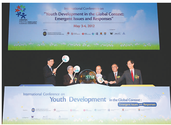
「共創成長路」惠及二十一萬中學生，吸引美國、以色列專家來港取經