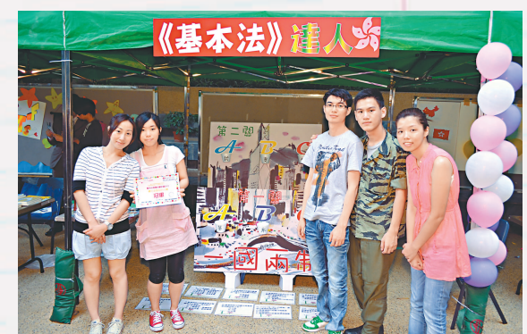
嶺南大學社區學院安排大批攤位遊戲鼓勵學生認識基本法

「基本法推廣活動計劃」進入第 4 屆，活動為期半年，節目包括攤位遊戲設計比賽、國情展覽、教育名人講座、海報標語創作比賽及展覽、辯論比賽等。學院於開幕禮當天率先舉行首項活動「攤位遊戲設計比賽」，四組參賽的學生，分別透過輕鬆、有趣及互動的遊戲方式，宣揚《基本法》，從而啓迪參加遊戲者的公民意識；經評選，最後由毅進計劃學生設計的攤位獲得冠軍！大會亦於新教學大樓中庭設置展板，介紹《基本法》的內容及實施情況，讓學生隨時隨地了解當中的細節，達成全人教育的宗旨。