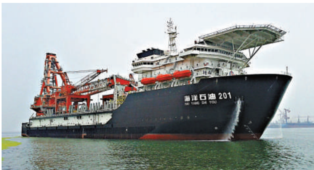
▲深水鋪管起重船「海洋石油201」在青島啟航