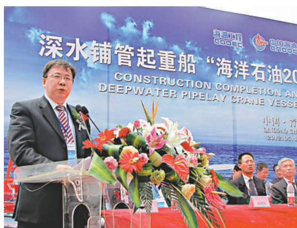
▲中國海洋石油總公司總經理楊華