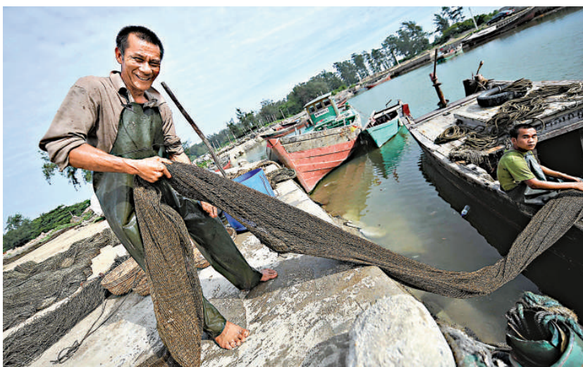
▲海口市三聯漁村的漁民 16 日在收網休漁

美聯社報導稱，越南外交部發言人在發表於越南外交部網站的聲明裡稱，越南認為中方的休漁決定是「無效的」。