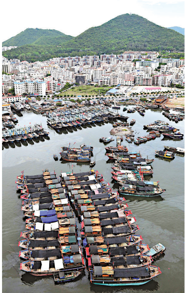
▲南海伏季休漁 16 日開始，漁船返回三亞港

【本報訊】綜合新華社、中新社十六日消息：包括北部灣、黃岩島海域在內的南海大部分海域 16 日 12 時起進入為期兩個半月的伏季休漁期，至 8 月 1 日 12 時止。據海南省海洋漁業部門統計，今年海南省休漁漁船達 8994 艘，休漁期內將實行「船進港、證集中、網封存、人上岸」管理，確保休漁漁船全部按時進港休漁。