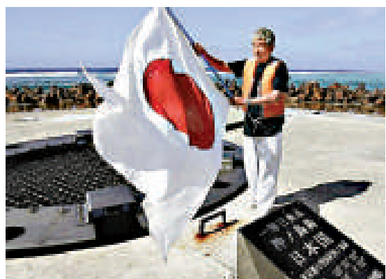
▲日右翼政客原曾登礁做秀 網上圖片

早在 2009 年，日本就向聯合國大陸架界限委員會申請南太平洋大陸架延伸，對此，中國以沖之鳥礁「是岩礁，無權設定大陸架」為由正式提出反對。