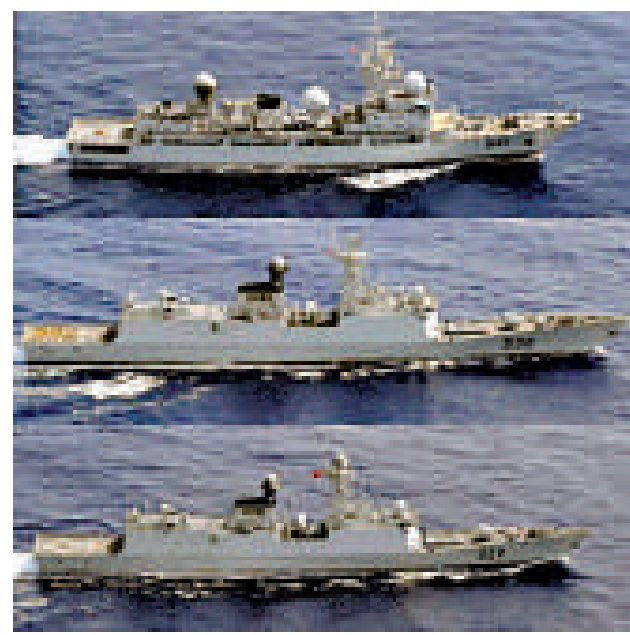
▲中國海軍 3 艘軍艦 14 日通過大隅海峽駛回東海 網上圖片

廂坊大師：沖之鳥礁還是歸聯合國的好。由國際海事或氣象組織管理，可以設置公益燈標或海況觀測裝置，數據歸全人類。其他要求一律不准。