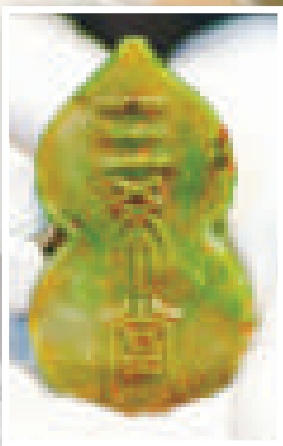
◀▶玉璽背面篆刻有「三希堂」三字，背面刻有三條螭龍 英國《每日郵報》

在歐洲曝光的中國皇室物品，近年的價位屢次被亞洲競投者搶至新高。但付款進度緩慢，甚至只拍不買，也成了一些拍賣交易的問題。今年3月31日，法國圖盧茲拍賣行Chassaing-Marambat以380萬歐元（連佣金），成功賣出一枚同樣與乾隆皇帝有關的18世紀玉璽。一年前，一位身份不明的華人客戶以1240萬歐元投得這個玉璽，但這位客戶只支付了220萬歐元而已。