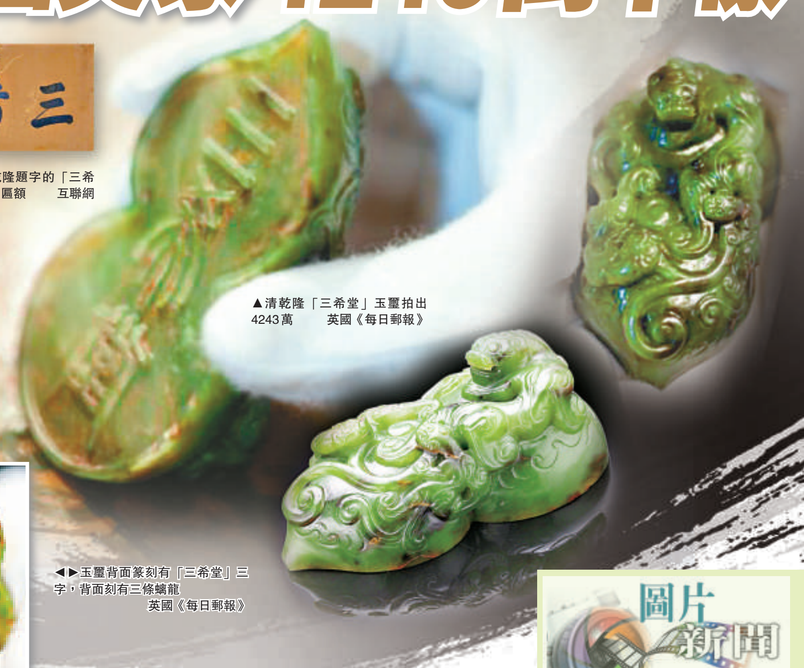
▲清乾隆「三希堂」玉璽拍出4243萬 英國《每日郵報》