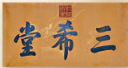
▲乾隆題字的「三希堂」匾額 互聯網

據寶龍拍賣公司介紹，這枚玉璽呈翠綠色，形狀是雙葫蘆，代表天地，寓意吉祥和長壽。印上清晰篆刻「三希堂」三個字，背部刻有大小各異的3條螭龍。玉璽材質晶瑩剔透，堪稱玉中極品。它由一位歐洲私人收藏家拿出來拍賣，曾經估計可以賣到100萬英鎊至150萬英鎊，最終以340萬成交，高出預計兩至三倍。