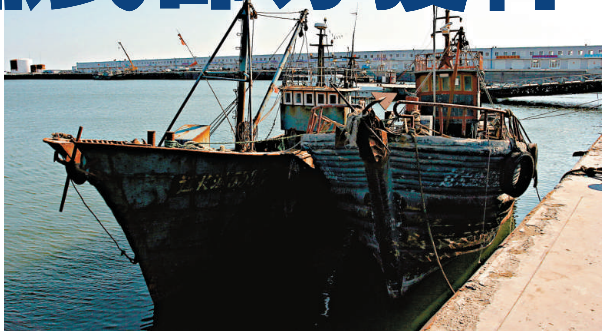
▲「遼丹漁23527」較早前已獲釋

「你說的事情，我們並不知情，我們也是從中國互聯網上看到相關消息。」這是朝鮮駐華使館17日就「3艘中國漁船被朝方武裝分子劫持」事件對《環球時報》做的回應。