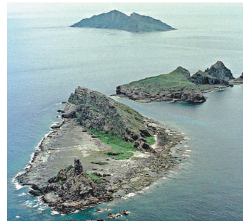
▲東京都議會124名議員中，只有7人贊成石原慎太郎「購買」釣魚島 資料圖片

中國外交部發言人曾多次表態，釣魚島及其附屬島嶼自古以來就是中國的固有領土，中國對此擁有無可爭辯的主權。日方對釣魚島及其附屬島嶼採取任何單方面舉措，都是非法和無效的，都不能改變這些島嶼屬於中國的事實。