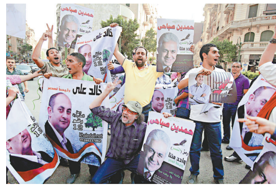
▲總統候選人薩巴希和哈立德·阿里的支持者20日在開羅分別集會

自穆巴拉克下台以來，軍方一直統治着埃及。儘管軍方承諾將把政權交給大選的獲勝者，但許多人認為，他們肯定會謀求長期對政治事務施加影響。現實地看埃及的前景，不應排除另一種可能性：該國最大的兩股勢力——軍隊和穆兄會最終找到一種辦法分享權力。大選的關鍵在於埃及將走向宗教統治，還是維持世俗政府，這將有待於事態的發展。以開羅解放廣場抗爭為代表的這場變革運動，如今正面臨真正的考驗——推翻獨裁政權不過是幾個星期的一幕戲劇，而向一個有效、穩固的民主轉型則完全是另一回事。