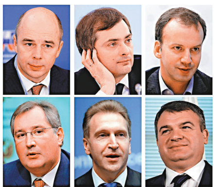
▲俄羅斯新政府成員：財政部長西盧安諾夫（左上）、副總理蘇爾科夫（上中）、副總理德沃爾科維奇（上右）、副總理羅戈津（下左）、第一副總理舒瓦洛夫（下中）、國防部長謝爾久科夫（下右）

【本報訊】綜合美聯社、新華社莫斯科21日消息：俄羅斯總統普京21日簽署命令，任命新一屆政府成員。新政府由1名總理、7名副總理及21名部長組成，其中四分之三的成員為新面孔。普京21日要求內閣要員們在全球經濟危機的艱難之際，必須努力履行自己的職責。 普京當天在克里姆林宮召開政府會議並宣布了新一屆政府成員名單。與上屆政府不同的是，本屆政府第一副總理職位由2個縮減為1個。此外，新政府還設立了兩個新部門，即遠東發展部和協調開放政府活動部；原衛生和社會發展部一分為二，在其基礎上成立衛生部及勞動和社會保障部。新政府中，梅德韋傑夫擔任政府總理，舒瓦