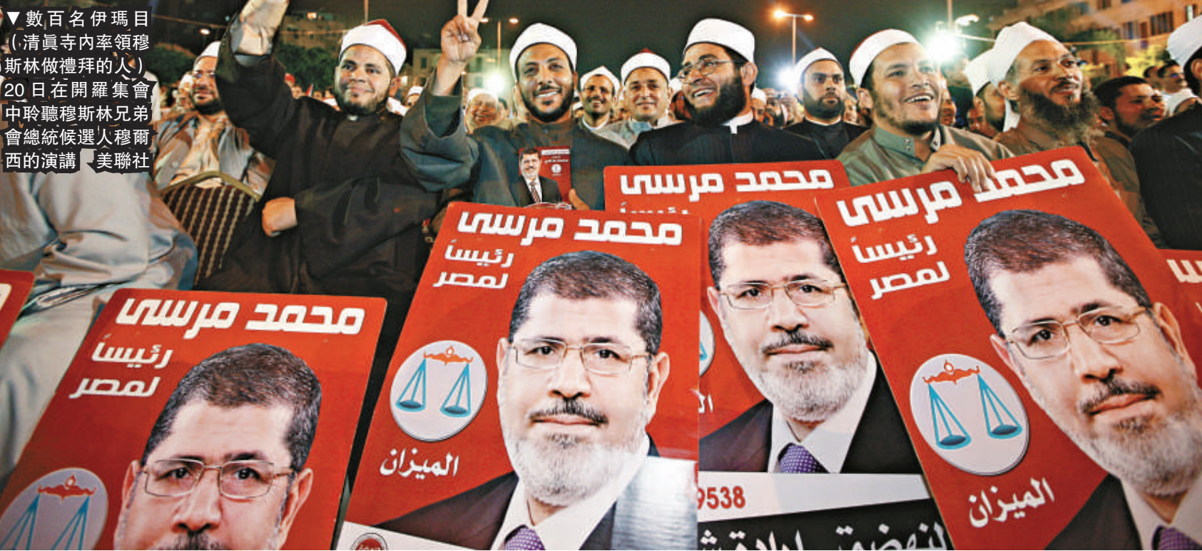
▼數百名伊瑪目（清真寺內率領穆斯林做禮拜的人）20日在開羅集會中聆聽穆兄會領袖穆爾西的演講

【本報訊】據路透社、新華社開羅21日消息：埃及將在23日至24日迎來前總統穆巴拉克下台後的首次總統選舉，穆兄會（簡稱「穆兄會」）能否「崛起」最受外界關注，目前12名候選人中有5人競爭尤為激烈。如果首輪無人勝出，6月中旬舉行決勝輪投票。