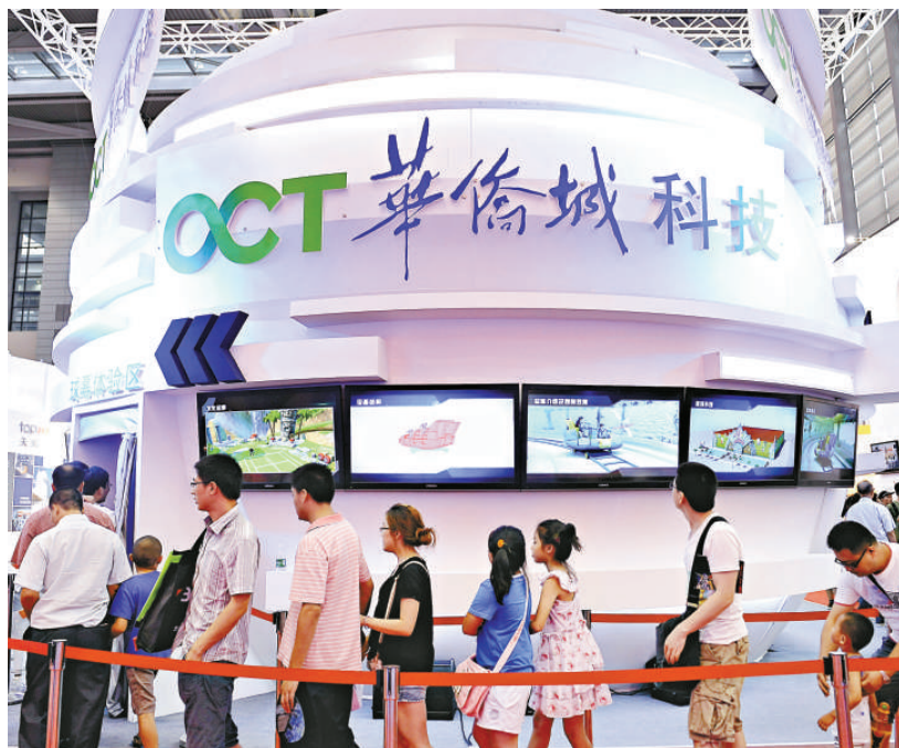
▲本屆文博會上，融合了科技的文化產品吸引觀衆眼球。圖爲觀衆在影視動漫館排隊等待體驗球幕電影

【本報記者王一梅深圳二十一日電】21日下午，歷時四天的第八屆中國（深圳）國際文化產業博覽交易會閉幕。本屆展會「文化和科技融合，創意與市場對接」特色進一步凸顯。據統計，科技型文化產業的成交額已經達到598.77億元（人民幣，下同），比上屆增長158.06億元，同比增長35.86%，約佔總成交額的40%。