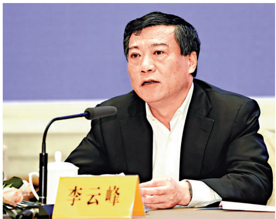
▲江蘇省委常委、常務副省長李雲峰表示，江蘇沿海三市各具優勢，未來將成爲江蘇乃至中國東部地區重要的經濟增長極

爲加快推進沿海開發戰略，江蘇省委、省政府制定了沿海開發五年推進計劃，重點推進180個重大項目，總投資超過1.3萬億元。沿海地區港口物流、金融融資、口岸服務、信息服務、濱海旅遊、研發設計等現代服