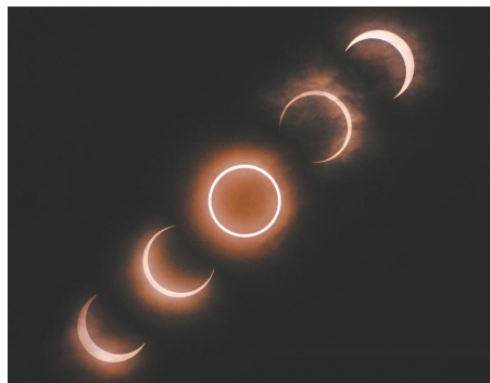
▲日本東京21日觀測到的日環食奇景

倫敦奧運火炬每個造價495英鎊，當局曾通知火炬手，欲想永久保存火炬，可在5月1日之前以199英鎊購買，而該日子之後的買價是215英鎊。倫敦奧運火炬手8000名，其中7300人由各地社區提名，經奧運當局選出參加火炬傳遞。