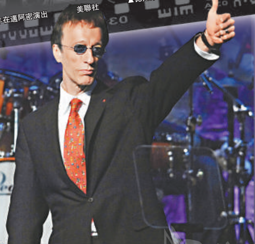
▲羅賓吉布2007年在加州BMI流行音樂頒獎典禮上領獎

莫里斯在2003年1月因為腸部扭曲而引起的併發症逝世，享年53歲。巴里和羅賓都非常傷心，因此宣布將不再以「比知」的名義做任何演出，象徵「比知合唱團」正式邁入歷史。事件亦對羅賓造成困擾，直到其逝世。