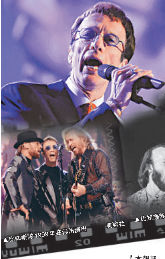
▲比知樂隊1999年在佛州演出