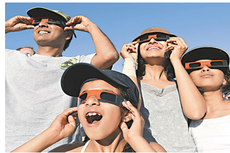
▲美國加州人20日觀測日環食

在人口密集的南加州，天空不見一朵雲，日食現象以遮蓋86%的太陽直徑達到高潮，其光芒仍然刺眼，但如果透過太陽濾鏡來觀賞，它好像一輪倒轉的新月。