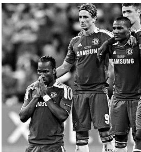
▲杜奧巴（左）是車路士的傳奇

【本報訊】綜合外電英國二十二日消息：剛協助車路士奪得歐聯的功臣杜奧巴，周二宣布於今夏離開效力8年的車路士。34歲的杜奧巴在官方網站上向球迷告別，車路士官方則向光榮離隊的杜奧巴致敬，並稱讚該名科特迪瓦射手為球隊傳奇。