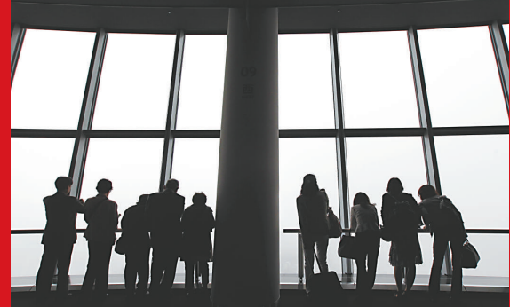
▲遊客們22日在「天空樹」第一觀景台上欣賞東京景觀

至於全世界最高建築物，則是迪拜828米高的哈里法塔，它和「天空樹」建築類型不同，屬於摩天大樓。