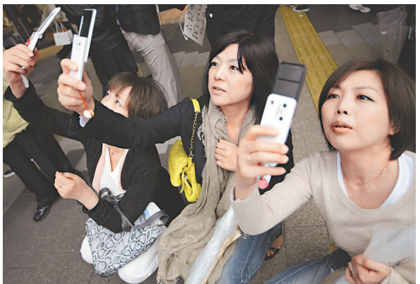
▲遊客們22日在剛剛對外開放的「天空樹」下拍照

「天空樹」去年11月正式成為健力士認證的全球最高電視塔，光建築費用就耗資400億日圓，使用的鋼鐵重量是埃菲爾塔的5倍、東京塔9倍。該塔原計劃建設高度為610米。考慮到可能與當時也在建設中的中國「廣州塔」為一個高度，建築方在2009年10月將塔的高度改為634米，從而成為世界第一高塔。