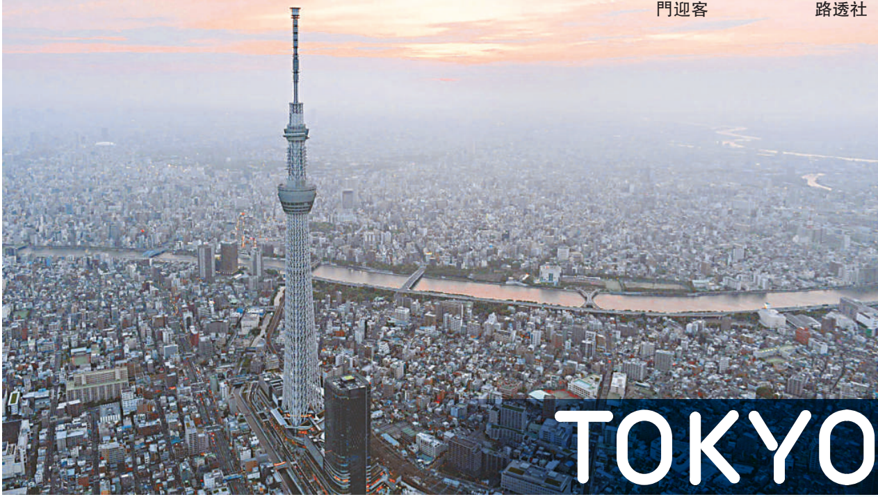
◀全球最高塔、634米的「天空樹」22日在東京開門迎客