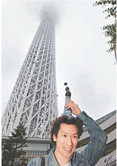
▲一名遊客22日梳着「天空樹」形狀的髮型排隊等待參觀