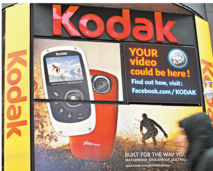
▲柯達近年迎合潮流，推出輕便的數碼相機，可惜未為市場接受，銷售額大跌