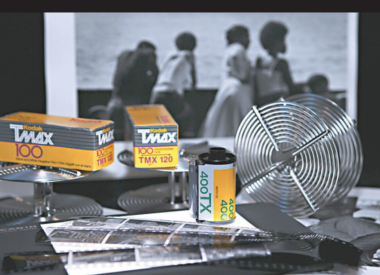
▲柯達以非林起家，與富士並列兩大非林公司