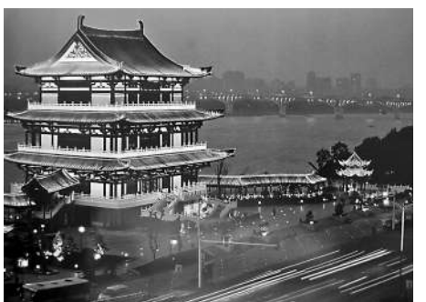
▲長沙雨花區，正在湘江東岸崛起

對此，在借用外資投資的基礎上，天心區將借助濱江地區優美的自然風光和優越的地理位置，推動區位資源與現代服務