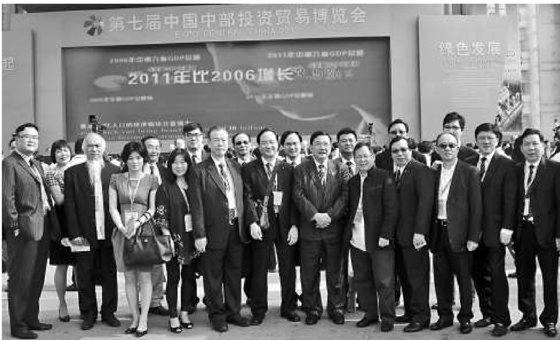
▲世界跨國公司部分總裁在湖南國際會展中心中博會開幕式廣場合影