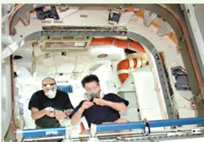
▲空間站太空人進入「飛龍」號太空艙後在內工作

SpaceX公司發射的「飛龍」號22日升空，25日與空間站成功對接。它將與空間站對接約一周，隨後於31日落入太平洋海域並被回收。