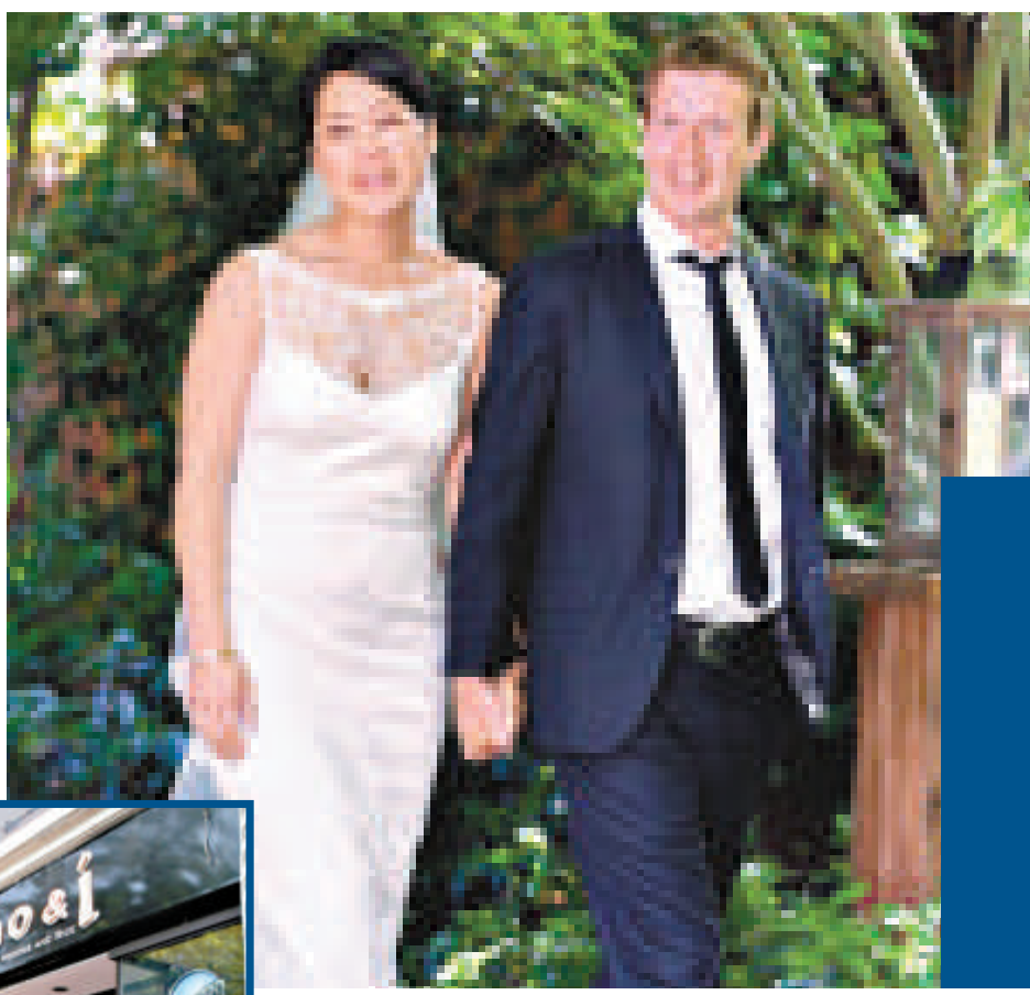
▲普莉希拉·陳19日與臉譜網站（Facebook）創辦人馬克·朱克伯格結婚 資料圖片