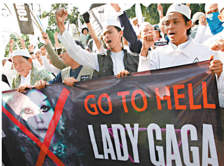
▲印尼穆斯林民眾25日在雅加達美國大使館外舉行集會抗議Lady Gaga原定下月3日在印尼舉行的演唱會