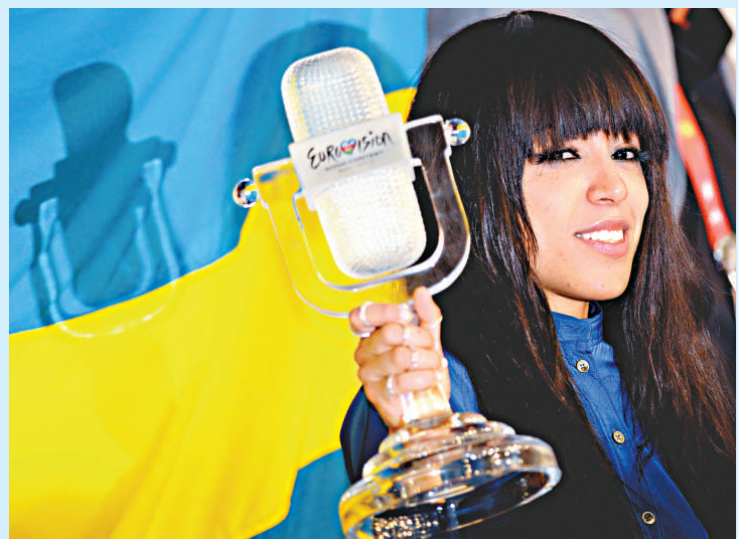
▲瑞典女歌手洛琳27日在歐洲歌唱大賽奪冠

印尼2.4億人口中有90%的人為穆斯林，是全世界最大的伊斯蘭民眾為主的國家，不過絕大部分民眾的行事方式，屬於溫和派穆斯林。過去，包括碧昂斯和Pussy Dolls在內的流行明星獲許在印尼演出，但必須遵守衣着較往保守的限制條款。