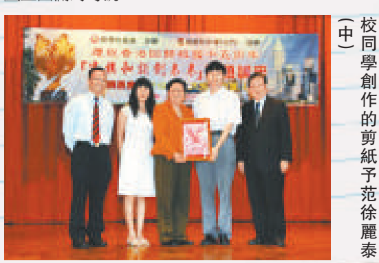
▲校長岑小瑩及校董致送由學校同學創作的剪紙予范徐麗泰

的疑問，分享對香港各話題的看法、自己從政的悲喜、工作情況等，聽得同學津津有味。面對不同的挑戰和考驗，范徐麗泰依然堅毅不屈，在政壇上屹立不倒，實與學校「自強不息」的校訓不謀而合。經過一個多小時的分享，專題講座在熱烈的掌聲中畫上圓滿的句號。