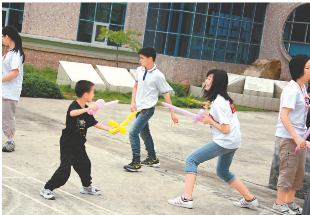
▲香港學生把扭好的氣球送給孤兒院學生，又與他們一同玩耍