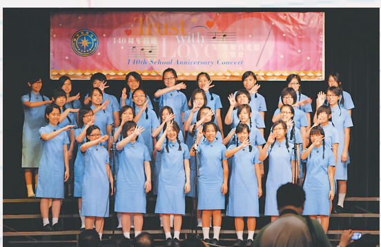
▲今年是真光 140 周年校慶，又是 Doreme 歌唱比賽 20 周年，別具意義

「今年 Doreme 的冠軍就是……」我們全班同學都屏息靜氣、手牽着手，緊張得閉上眼睛，多個月來的努力，成或敗就在此刻揭曉了。「3B！」隨著評判的宣布，我傳出興奮的尖叫声，依稀聽見一句句「我們贏了！真的贏了！」同學面頰上淌着感動歡喜的熱淚，內心像被充了氣般湧出難以形容的雀躍，沒想到我們竟然能奪魁。我們的目標只是季軍，隨着評判宣布季軍不是我們，我們的心早已沉到谷底了，沒想到我們能在表現出色的高年級隊伍中贏得了冠軍，多個月來的努力耕耘終於結出豐碩的成果。還記得全班同學每天午飯、放學後及假期回校參加練習，大家由點頭微笑的同學，不知不覺