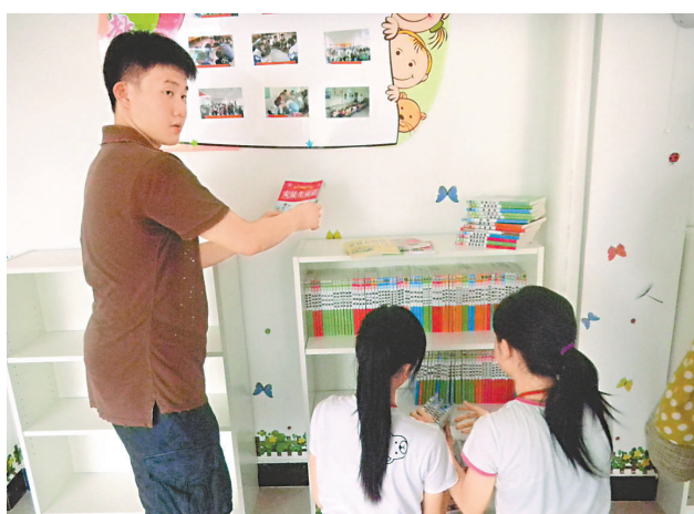
▲香港學生義工先組裝書櫃，放進圖書，為廣東肇慶兒童之家建立小型圖書館 本報記者于敏霞攝

一個香港學生問一個孤兒：「我們一樣大，你為什麼這麼矮？」「那你為什麼這麼高？」「我每天喝牛奶」……生存環境太大的差距，導致不了解、遺憾時間太短，不能充分交談；「我們不能期望，一次活動會給學生帶來徹底影響」，但總要邁出第一步、第二步，希望「能夠主動報名參加慈善活動的孩子，將來一定是一個好人！」