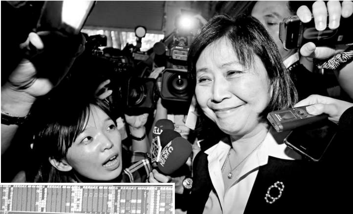
▲劉憶如（前）29日辭任「財政部長」，並表示辭職後不會再任公職。

對於劉憶如突然請辭，不分藍綠都表示驚訝，至於外界關切會不會影響證所稅修法，國民黨中央政策