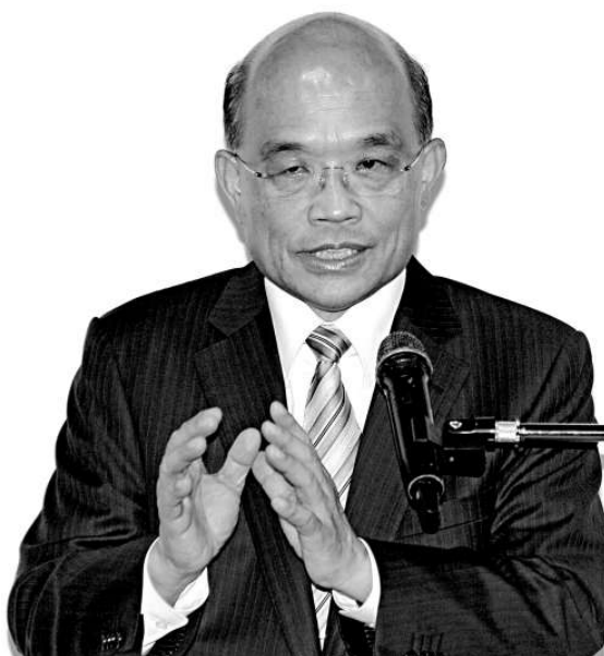
▲蘇貞昌當選民進黨主席，27日在台北辦公室，向媒體發表當選感言時表示，兩岸政策方面，會方法靈活與時俱進。

台灣經濟景氣持續低迷，台灣工業總會理事長許勝雄為此向高層疾呼，盡速召開「全台財經會議」，以凝聚朝野共識，讓台灣經濟從谷底翻轉。許勝雄建議，時間最好在6月底前，議題方面他表示應優先討論在兩岸後ECFA時代，台灣與大陸是否有更積極的合作？台灣要如何面對韓國等。中通社