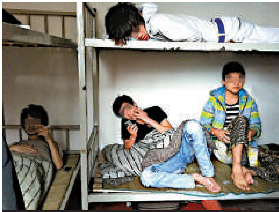
▲出租屋內等待賣腎的男孩們

據悉，內地每年有近100萬名依靠透析維持生命的腎病患者；但過去一年，國內合法進行的腎移植手術還不足4000例。巨大的需求導致地下賣腎中介興起，搭建非法網絡，從中牟取暴利。