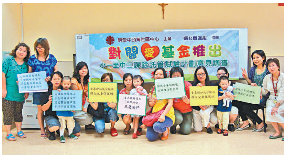
▲關愛基金推出小一至中三課餘託管試驗計劃意見調查昨日發布

同為「基層媽媽」的黃太亦稱，託管服務不足亦會帶來社會問題，「雖是家庭主婦，亦不想因孩子被困在家裡，想找份工來補貼家用，畢竟有很多問題真的只能用錢來解決。若設立「屋邨保母」便可解決很多困難，讓婦女做想做的工作，亦可惠及社會」。