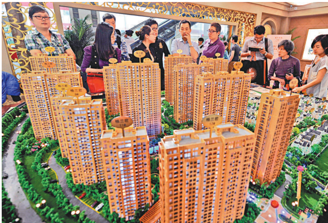
▲廣州樓市5月出現成交「井噴」，創下自2010年10月份限購以來最高紀錄

業內分析指，今年農曆春節以來，廣州樓市成交持續偏冷，持幣待購的市民普遍持觀望態度，而開發商的促銷也一直沒有達到市場預期；在開發商5月的