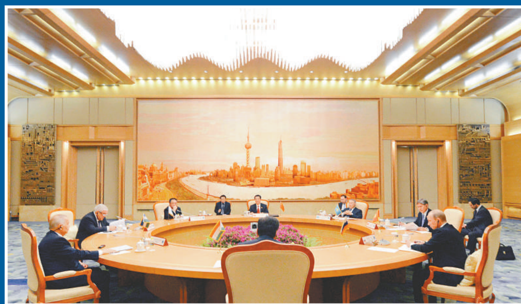
▲上海合作組織成員國元首理事會第十二次會議在北京舉行小範圍會談現場。

對於即將在北京召開的本次峰會，胡錦濤提出以下期待：即將召開的北京峰會是一次繼往開來的會議，與會各成員國元首將深入國際和地區形勢發展變化給上海合作組織發展帶來的機遇和挑戰，對本組織未來發展作出規劃和部署。會議將批准和簽署一系列重要合作文件，為本組織長遠發展明確戰略方向和目標。相信在各方共同努力下，這次峰會將取得成功，譜寫上海合作組織發展新篇章。