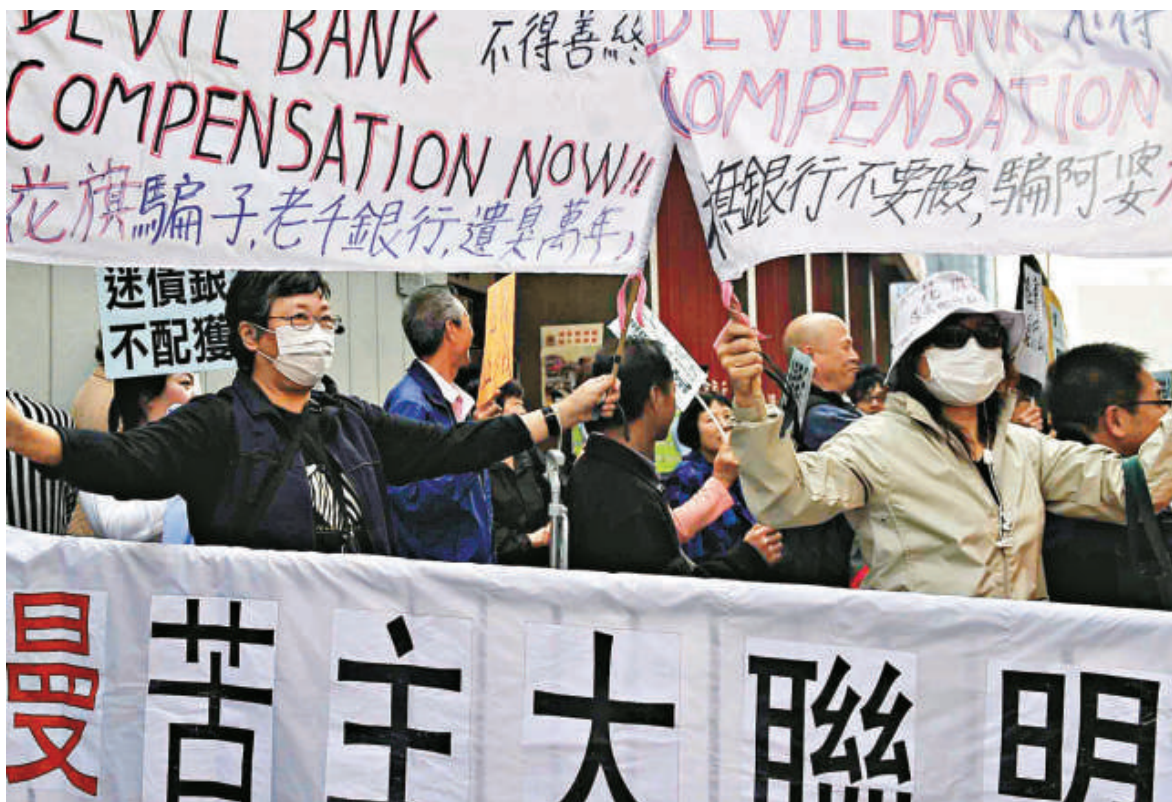
▲雷曼迷債爆煲事件，累及本港數以萬計的投資者苦主，美國當局實是責無旁貸